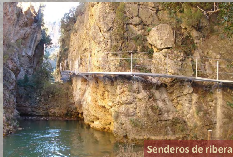
Senderos de ribera