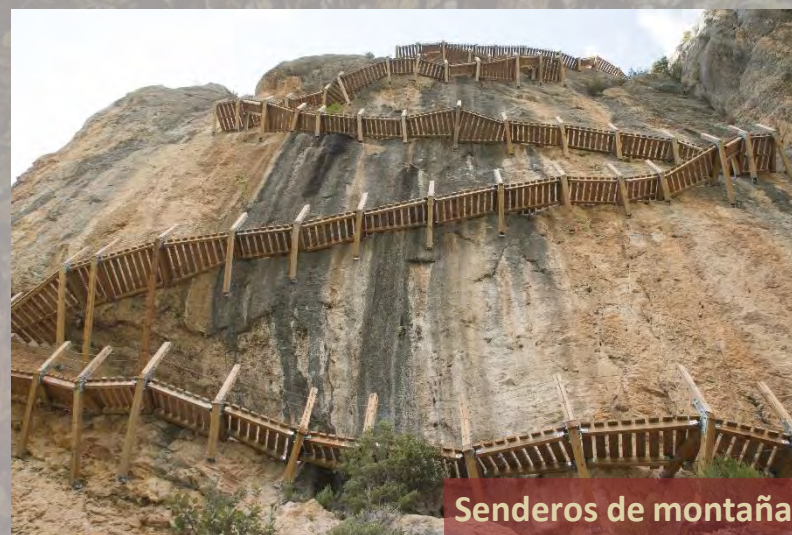
Senderos de montaña