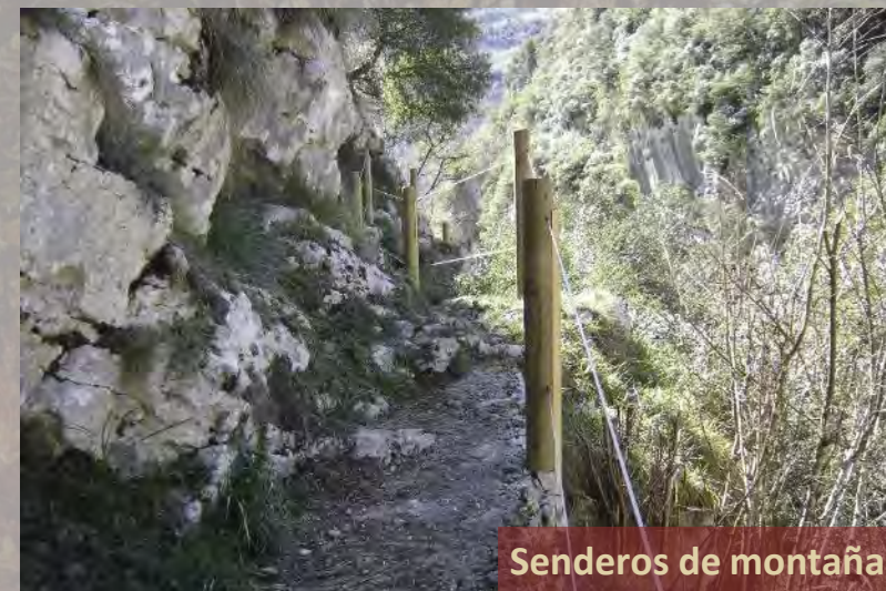
Senderos de montaña