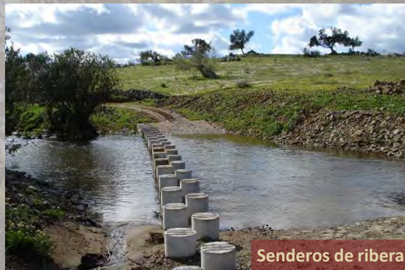
Senderos de ribera